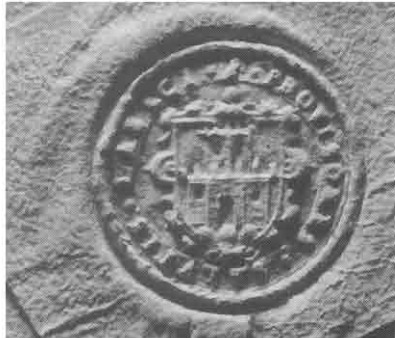
MESTNI PEČAT LJUBLJANE IZ 16. STOLETJA IZVEDEN KOT "SUHI ŽIG"