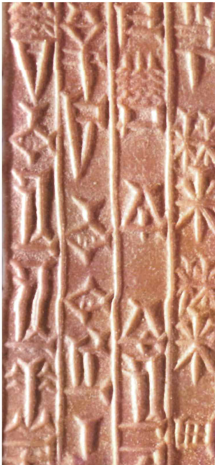
RELIEFNI ODTIS PREDANTIČNEGA VALČNEGA ŽIGA