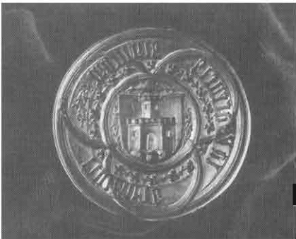
PEČATNIK MESTA LJUBLJANE IZ 15. STOLETJA