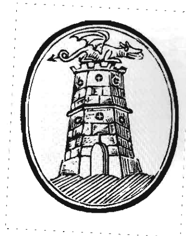
ŽIG Z LJUBLJANSKIM SIMBOLOM IZ 19. STOLETJA