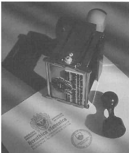
ŠTAMPILJKI IN NJUNA ODTISA - ŠTEMLJJA